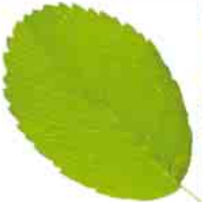
Üstte günümüze ait kayaarmudu yaprağı örneği görülmektedir.

Kayaarmudu ağacı kışın yapraklarını döken küçük bir ağaç türüdür. Yapraklarının kenarları tırtıklıdır ve genellikle 2-10 cm boyunda ve 1-4 cm enindedir. Resimde fosilleşmiş halini gördüğümüz kayaarmudu yaprağı da aynı özelliklere sahiptir. Eosen döneminde, yani bundan 54-37 milyon yıl önce fosilleşmiş olan bu yaprak, yaklaşık 50 milyon yıldır bu ağacın hiçbir evrim geçirmediğinin açık bir kanıtıdır. Kayaarmudu ağacı yaprakları ve çiçekleri ile ilk yaratıldığı günden bu yana aynı özelliklerle varlığını sürdürmektedir.